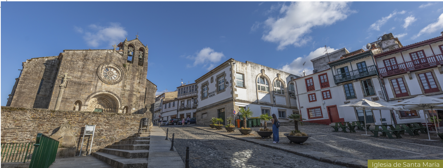
Iglesia de Santa María

■ La salida de Miño, con el marco kilométrico 74,159 como señal de que se abandona el núcleo urbano, se lleva a cabo descendiendo para cruzar por una pasarela segura la vía de tren. Se llega así a una zona llana muy fácil de recorrer, pegada a la desembocadura del río Lambre, que nace 15 km aguas arriba. Si la marea está muy baja es posible ver los restos de un barco que en su día, muchos decenios atrás, fue encallado en ese lugar.